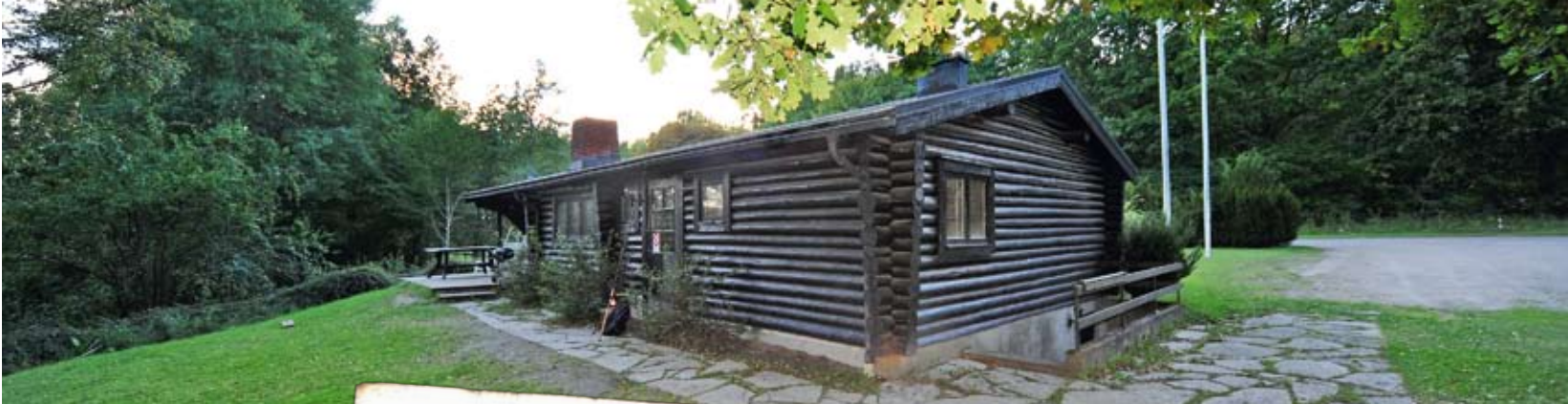
Abu-stugan anno 2011. ↑