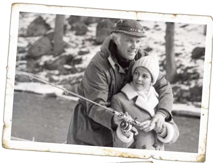
Lennart Borgström visar Silvia, vår nuvarande drottning, hur man fiskar, mars 1976.