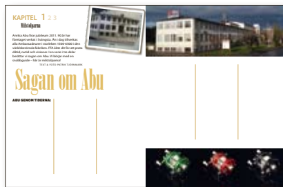
FFA nr 7