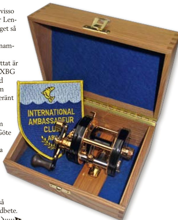
Ambassadeur de luxe, guldrullen med detaljer i 24 karats plätning är en av Lennarts alla ideér som än i dag lever kvar. Bilden visar 5500 CDL från 2011. ↓

Hi-Lo var precis framtagen som också visade sig vara ett mycket effektivt gäddbete. Emellertid fick alltid Gunnar mer fisk >.....>